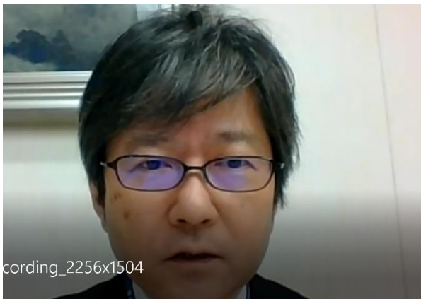
(左) 全国社会福祉協議会・古都副会長の挨拶